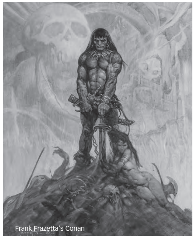
Frank Frazetta's Conan

Met dit korte fragment weet Howard eigenlijk de hele thematiek van Conan en de wereld van Hyboria krachtig samen te vatten. Howard zag de mens als voor eeuwig veroordeeld tot een soort sisyphusarbeid, dat wil zeggen: een zware, vruchteloze inspanning die nooit tot voltooiing zal worden gebracht, gelijk het personage Sisyphus uit de Griekse mythologie. De wereld van Conan is onze wereld, maar één die bestond voordat de door ons bekende geschiedenis werd opgeschreven en een ramp van apocalyptische proporties alle spo-